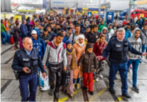
Der Flüchtlingsstrom am Hauptbahnhof hält an. Nächste Woche kommen Wiesen-Besucher dazu

München - Noch neun Tage bis zur Oktoberfest-Eröffnung 2015. Mit dem Wiesen-Anstich und dem anhaltenden Flüchtlingsstrom am Münchner Hauptbahnhof