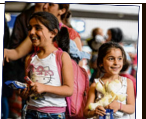
Flüchtlingskinder werden nach einem Deutschkurs drei Monate später in den Grund- und Mittelschulen eingeschult

Aushilfs-Lehrer zur Verfügung. Der SPD geht das nicht weit genug. Der Bildungspolitische-Sprecher Martin Güll: „Wir stehen vor großen Personalproblemen.“ Die SPD fordert 1000 neue Lehrstellen und bis zu 20 Millionen Euro für die Schulen. (th)