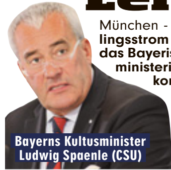
Bayerns Kultusminister Ludwig Spaenle (CSU)

München - Der Flüchtlingsstrom stellt auch das Bayerische Kultusministerium für das kommende Schuljahr vor Probleme. Kultusminister Ludwig Spa-