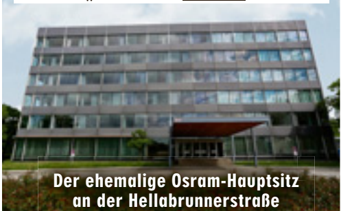
Der ehemalige Osram-Hauptsitz an der Hellabrunnerstraße

Das geht aus dem neuesten Standortbeschluss zur Unterbringung von Asylbewerbern hervor. „500 bis maximal 800 Personen können auf dem Osram-Gelände untergebracht werden“, so ein Sprecher des Sozialreferats. Einziehen werden die Flüchtlinge voraussichtlich Ende September. Eigentlich sollten auf dem Osram-Areal bis zu 370 neue Wohneinheiten entstehen: Wohnraum für 850 Leute, eine Kita und ein Kindergarten. Bis es mit dem Bau losgeht, dürfen jetzt aber erst einmal die Flüchtlinge einziehen.